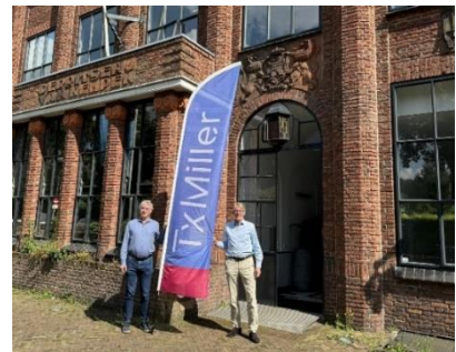
Figuur 1 Karpervijver 17, 3703 CJ Zeist

De naamgeving is aangaande Miller een knipoog naar de achternamen van de beide oprichters, namelijk (Roze)Muller en Mulder. Terwijl ‘Tx’ een internationale aanduiding is voor ‘Transplantation’. Daarnaast verwijst ‘Miller’ met vertaling ‘windmolen’ naar de Nederlandse origine van het initiatief.