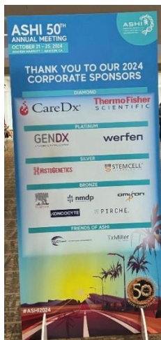
Figuur 2 50e ASHI conference, Anaheim, CA, USA gehouden in oktober 2024