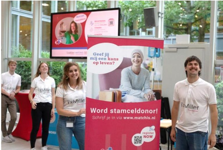
Figuur 3 Stamcel donor recruitment activiteit op de Hogeschool in Utrecht, 19 september 2024